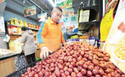
市民在对口帮扶超市采购。

本报讯(记者肖峰国通讯员付昱)日前,和平区商务局在多伦多道福方里精心打造“对口帮扶甘肃农产品旗舰店”,使之成为了和平区利用消费扶贫、精准扶贫,帮扶甘肃省会、舟曲、靖远三县,展销其农产品的重要窗口。