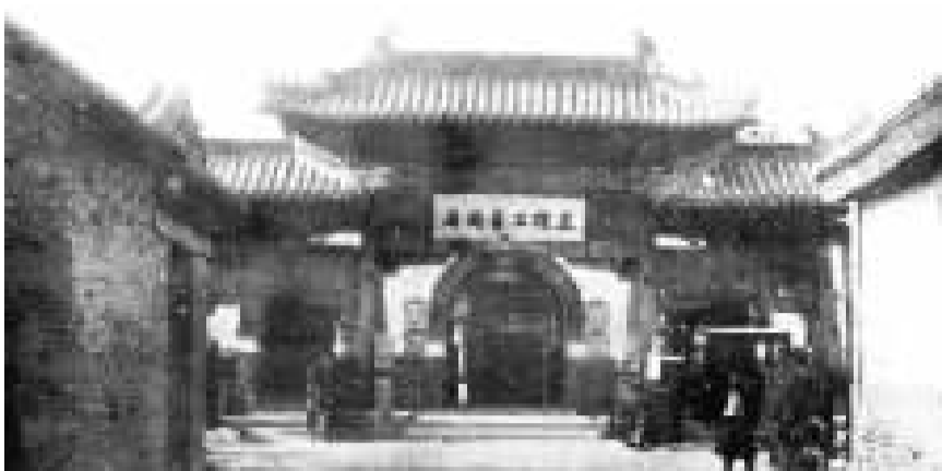
成立于1903年的直隶工艺总局