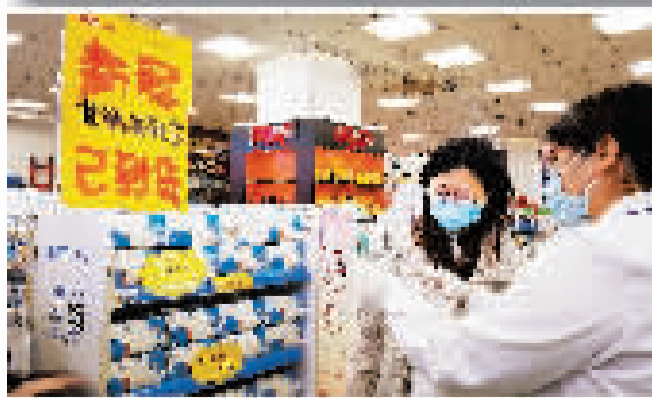
3月17日,新冠抗原检测试剂盒在天津市老百姓大药房上架销售,市民可持身份证登记购买。