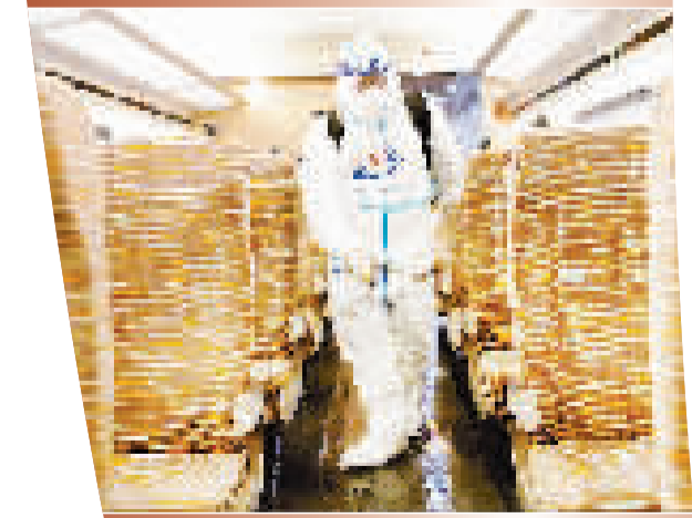
近日,为全力防止疫情通过铁路传播,有效保障旅客乘坐安全,天津铁路疾控中心加强疫情防控工作,对入库高铁列车进行预防性消杀作业,保证广大旅客出行安全。 本报记者 刘乃文 通讯员 蔡树田摄