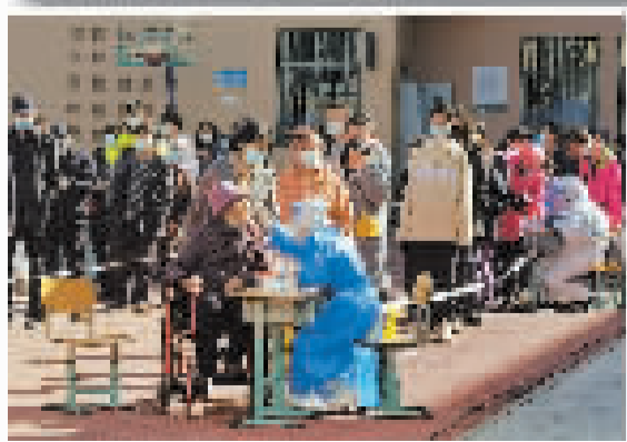
3月14日,河西区平山道小学核酸采样点秩序井然。