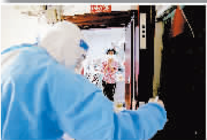
大门打开,居民向医护人员问好,这是最温暖的问候。