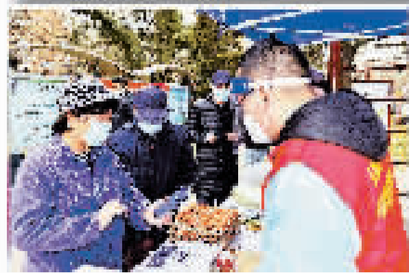
连日来,为保障南开区居民生活供应,南开区居民生活必需品保供仓库的工作人员紧张备货,保证每天14时老百姓能在社区买到蔬菜,仓库物资随出随进,确保供应充足。