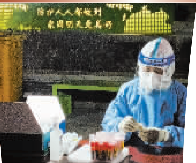
3月11日,津南区辛庄镇首创城社区核酸检测现场,医护人员背后的广告牌上写着的标语,疫情防控常态化已深入人心。