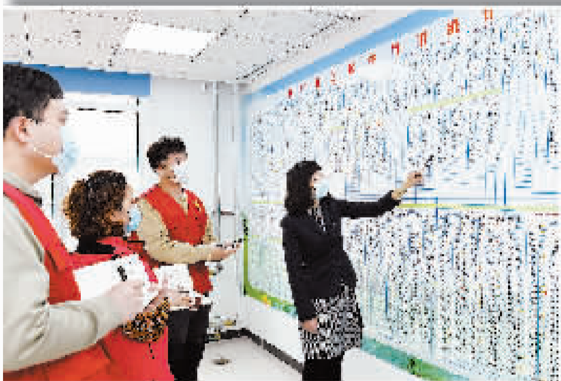
连日来,东丽区新立街道丽昕社区采取多种举措,守好疫情防控线。图为社区实行“挂图作战”,将社区管理变成直观示意图,使疫情防控管理更精准有效。