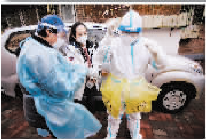
3月13日,支援南开区嘉陵道街罗江东里的第二人民医院医护人员入户前用胶带在身上绑上垃圾袋,用于投放采集核酸棉签废弃物。