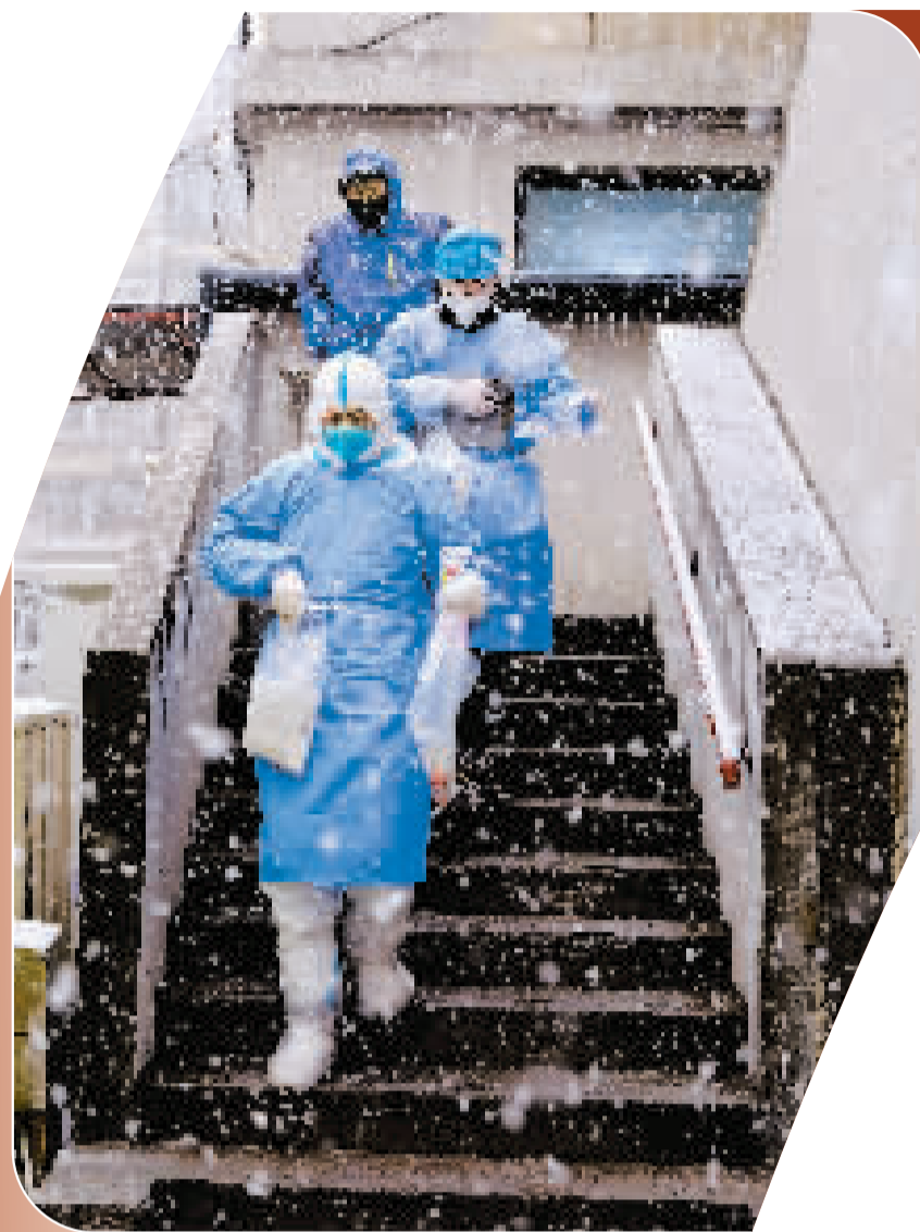
3月18日,市第二医院医护人员冒雪来到河北区望海楼街中远里社区金波里小区进行入户核酸检测。

近期,本市疫情防控形势仍然严峻复杂。各部门迅速行动,精准有序做好“外防输入、内防反弹”各项工作,从严从紧、毫不松懈抓好疫情防控,坚决守护好人民群众生命安全和身体健康。同时,相关部门积极做好生活必需品生产供应,保障好群众就医需求,确保群众正常生产生活平稳有序。在疫情面前,市民积极配合防疫工作,全社会共同努力,抗击疫情,人人有责。