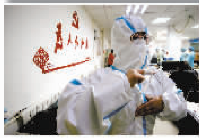
3月11日清晨6时,支援南开区凤园南里社区大筛任务的第二人民医院医护人员穿戴防护服准备前往核酸检测点位。