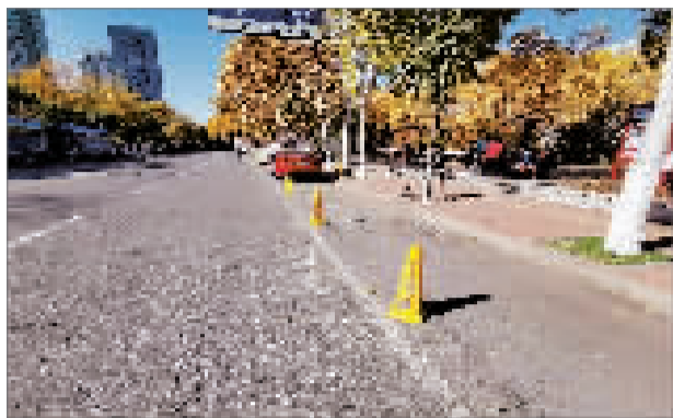
一位经过此处的市民告诉记者,这几条道路上的公众车位确实不少,但是多数都被塑料锥筒占上了,给想停车的车主带来了不便。

11时许,记者以市民身份拨打了公众停车客服电话反映问题。12时左右,公众停车红桥分公司的一位工作人员联系记者说,路边的公众车位确实不应该用塑料锥筒占上。青年路、怡德路、怡闲道等道路上的公众车位几乎都是