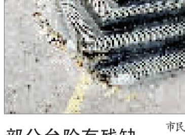
部分台阶有残缺 李先生反映,南开区黄河道和广开四马路交口的西北侧便道上,部分台阶有残缺。

本版相关稿件线索由市政府办公厅、津云新媒体《政民零距离》栏目提供。 http://ms.enorth.com.cn/zmljl/