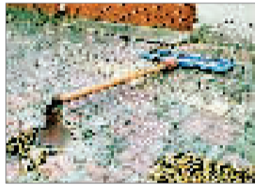
路名牌锈蚀倒地 刘先生反映,河东区十四经路东段,有一个金属路名牌锈蚀倒地,有碍通行。