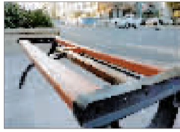
候车椅椅面损坏 张先生反映,河北区中山北路北宁公园公交站前,有一个候车椅的椅面出现损坏,无法使用。