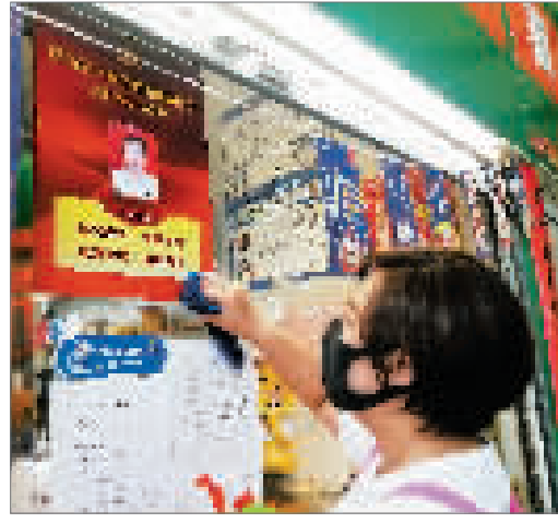
金角菜市场入党申请人商户做出诚信承诺。