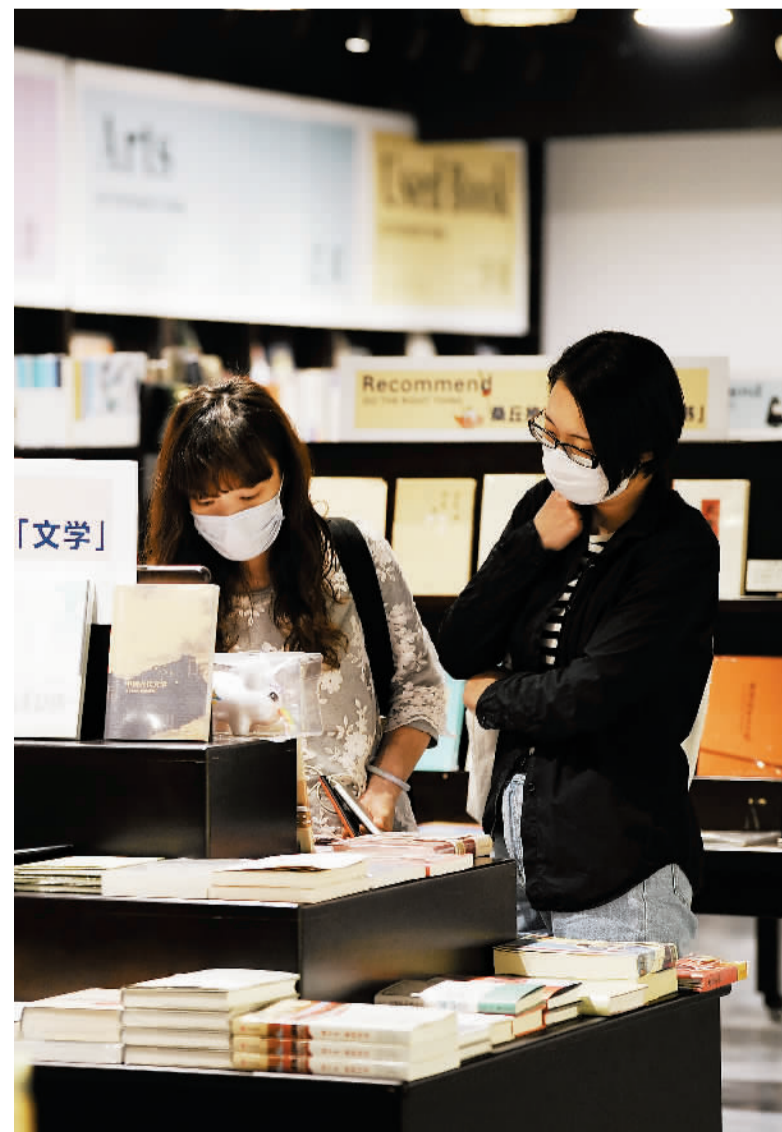
疫情期间，虽然书店客流减少，仍有爱书人坚持“逛书店”。