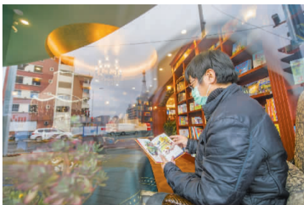
有着“天津莎士比亚书店”之称的天津外文书店，为喜爱国外原版图书和文艺社科类中文精品图书的读者提供了好去处。3月恢复开放后，吸引了读者一解阅读之渴。