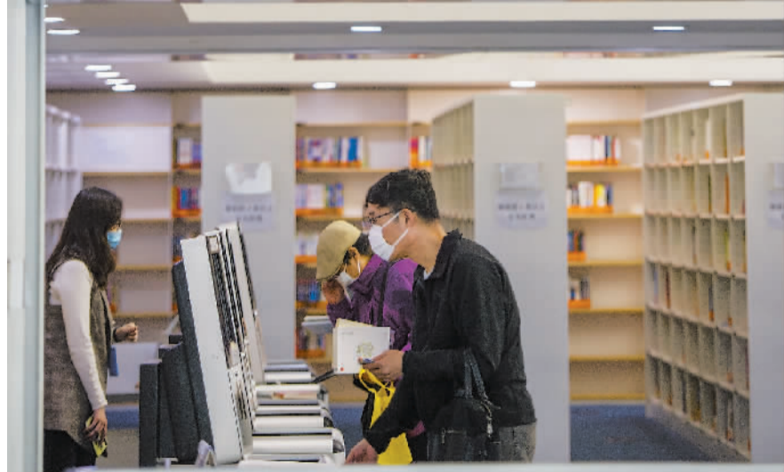
天津图书馆于3月26日恢复开放，品书香的日子回来了。目前天津图书馆复康路馆和文化中心馆部分区域对读者开放，提供图书、期刊的借还服务，两馆为读者提供图书82万册。因实行限流措施，读者需网络实名预约才能进入，在馆内借还书时间不超过30分钟。