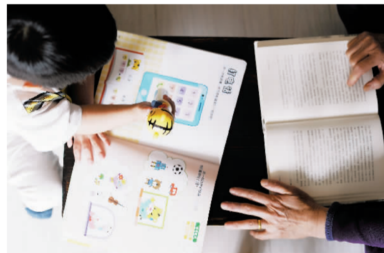
疫情期间，幼儿园停课。洪女士在家陪伴小孙子读书，培养阅读兴趣。