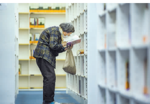
“盼了好久，终于等到这一天。”虽然进馆需要执行一些程序，热心读者仍坚持前往，一位老者在书架前读书的样子令人感动。