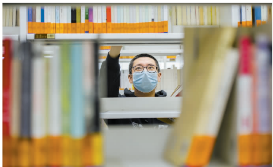
年轻人在书海中寻找自己心仪的图书。