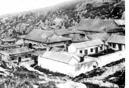
民国时期的泰山碧霞祠

“摩喝乐”源自梵语,在佛教文化中被称为“摩睺罗迦”或“莫呼勒迦”,是护持佛法的“非人”大力神之一(天龙八部之一)。民间另有传云,说摩喝乐原是释迦牟尼的亲生儿子,经过七年的孕育才降生,天资无比聪明。此说尤其对摩喝乐在以后民俗生活中的角色演化提供了基础与想象空间。摩喝乐也叫“摩睺罗”,宋代的孟元老在《东京梦华录》中说摩喝乐“本佛经摩睺罗,今通俗而书之”。 摩喝乐常规为泥制、陶土制,古人也象象牙、美玉、佳木、蜡等来制作摩喝乐,这在历代文献与出土文物中均有所见。最大众化的摩喝乐泥娃娃也被俗称为泥娃娃,随时可供人们抱取,或捏男娃,或求女娃,随心所欲。事毕,大家皆会留下些许喜悦。书中又说,捏回家的泥娃娃照样要天天